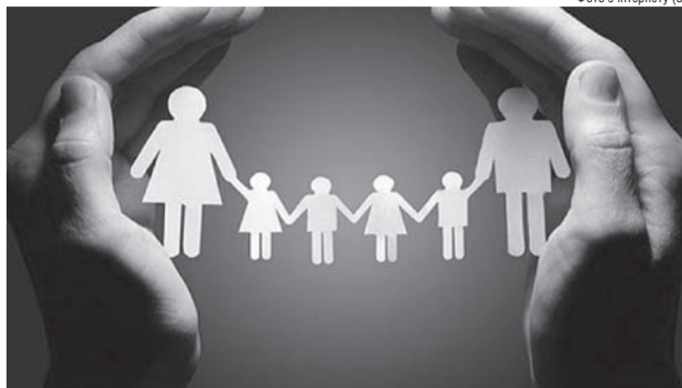
Фото з інтернету (3)

Пакунок малюка. Йдеться про адресну соціальну допомогу сім'ям, у яких народилася живонароджена дитина, у разі відсутності обох батьків — допомога родичам, які в установленому порядку