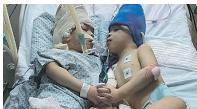
Бразильських близнюків, з'єднаних головами, вдалося роз'єднати за допомогою віртуальної реальності.